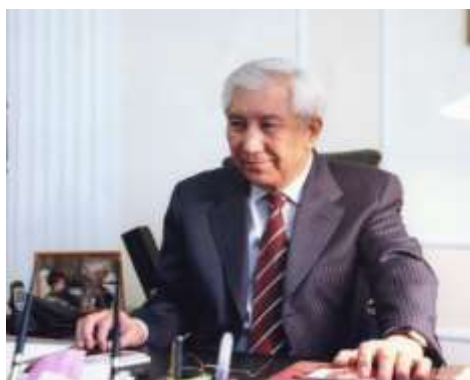
Мырзатай Жолдасбеков ф.ғ.д., профессор түркітану кафедрасының меңгерушісі Байланыс мәліметтері: эл.почта: zholdasbekov@enu.kz

Іс тәжірбиесі: жалпы стаж 58, оның ішінде 34 өндірістік 2012 жылдан бастап қазіргі таңда түркітану кафедрасының меңгерушісі; 2006-2012 жж. – Президенттік мәдениет орталығының директоры; 2004-2006 жж. – «Еуразия» гуманитарлық зерттеулер ғылыми орталығының директоры; 2000-2004 жж. – Л.Н.Гумилев атындағы Еуразия Ұлттық университетінің ректоры; 1997-2000 жж. – ҚР СІМ Дипломатиялық академияның ректоры; 1993-1997 жж. – Қазақстан Республикасының Иран Ислам Республикасындағы Төтенше және өкілетті елшісі; 1991-1993 жж. – Қазақ КСР Премьер-министрінің орынбасары; Қазақстан Республикасы Президентінің Кеңесшісі; 1988-1990жж. – Қазақстан Компартиясы Орталық Комитетінің Идеология бөлімінің меңгерушісі; 1987-1988 жж. – Қазақстанның оқу министрі, Білім министрінің бірінші орынбасары; 1977-1987 жж. –Талдықорған педагогикалық институтының ректоры; 1960-1977 жж. – С.М.Киров атындағы Қазақ мемлекеттік университетінің оқытушысы, аға оқытушысы, доценті, филология факультетінің деканы.